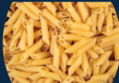
Penne Temos opção sem glúten!