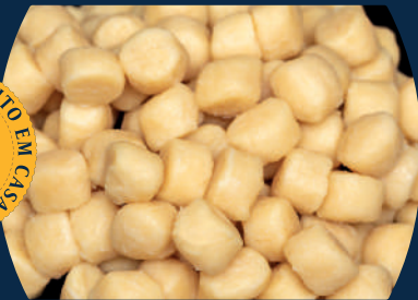
Gnocchi Temos opção vegana!